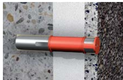
Фрагмент: Восстановление поверхностей, подверженных воздействию атмосферных факторов