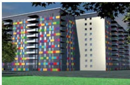
Восстановление поверхностей, подверженных воздействию атмосферных факторов